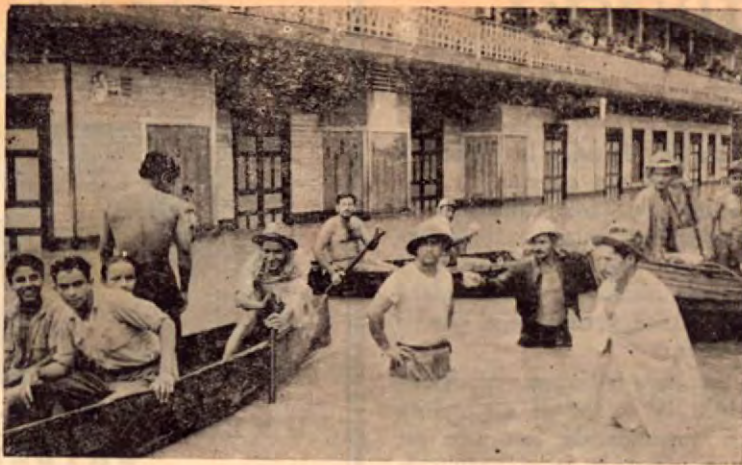
Inundaciones en Puerto Cortés

COSTA RICA DE AYER Y HOY, comprensiva de su gran labor en los afanes industriales, les extiende su mejor saludo y les desea mucho éxito en su fábrica y en sus negocios.