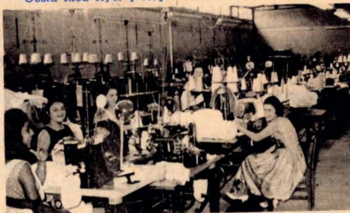
Hábiles operarias del departamento de confección, en un ambiente de compañerismo y confraternidad, se dedican a sus labores.