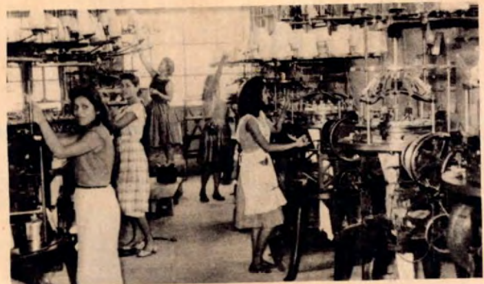
Parte de la maquinaria textil, traída especialmente para dar cumplimiento a los crecientes pedidos de mercaderías.