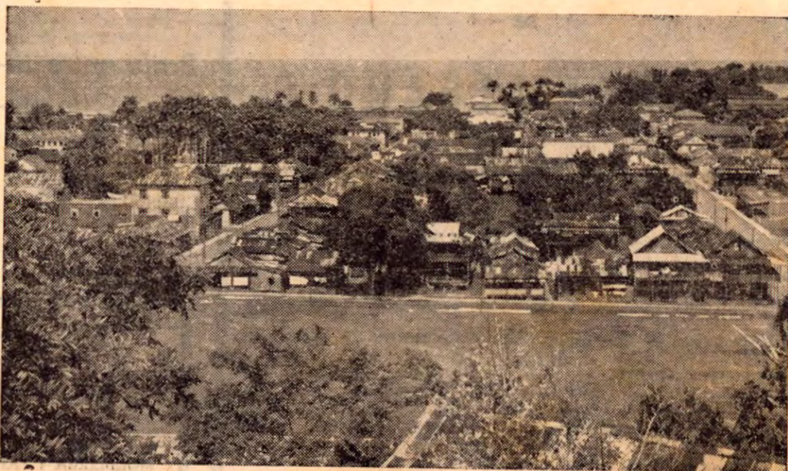
Una vista de Puerto Limón, la ciudad de las bicicletas, en cuyo seno el turista admira la hermosura única de su parque, y en las riveras de la bahía la maravillosa belleza de sus playas.