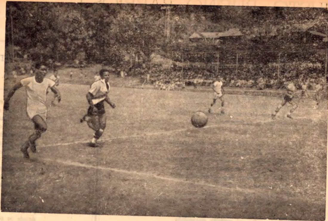
Una de las primeras poblaciones del país, que contó con Estadio para jugar fútbol y basket de noche, fué Golfito, he aquí uno de los primeros juegos el día de la inauguración.

Le recordamos que estos programas dominicales tienen una gran aceptación entre el público radio-escucha, debido a su variedad y especialmente por el enorme interés que despierta, por el cual son de mucho beneficio para los comerciantes, en lograr un máximo en rendimiento en sus ventas.